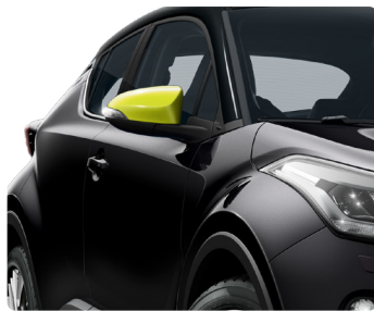
Декоративні накладки бокових дзеркал, пофарбовані