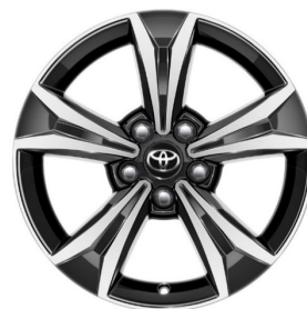
Легкосплавні диски 17", двокольорові