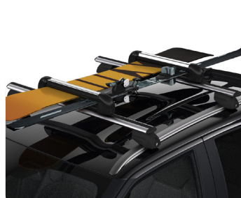
Кріплення для лиж на дах, зчпний пристрій