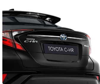
Декоративна накладка дверей багажника, верхня, хромована