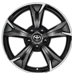
Легкосплавні диски 17", двокольорові