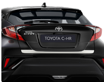
Декоративна накладка дверей багажника, хромована