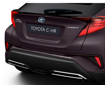
Захисна накладка заднього бампера