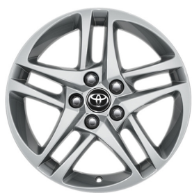
Легкосплавні диски 17", сріблясті