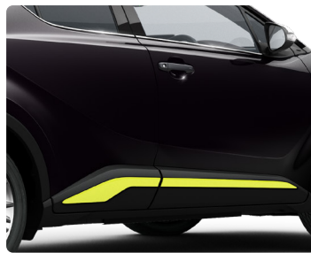
Декоративна накладка дверей, пофарбована