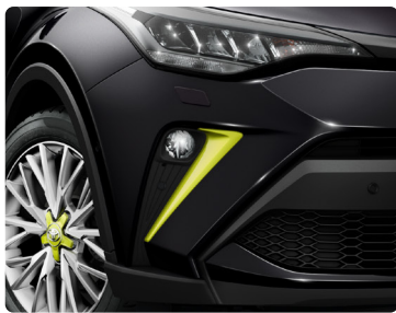
Декоративні накладки протитуманних фар, пофарбовані