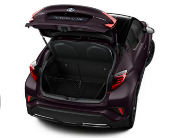
Сітка кріплення вантажу (горизонтальна, вертикальна)