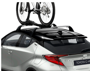
Кріплення велосипеда на дах (зліва), поперечини даху