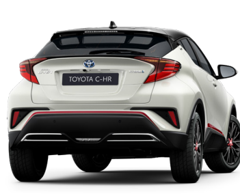
Комплект декоративних наклейок кузова, червоні