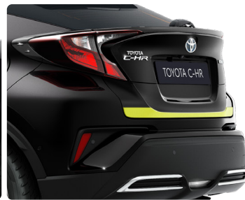
Декоративна накладка дверей багажника, пофарбована