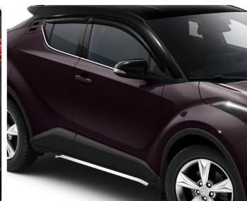
Декоративні порogi та дефлектор вікон